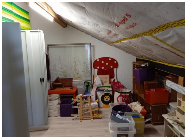
Photo du local qui doit être transformé en local de sieste pour l'APEMS

Plusieurs investissements sont prévus dans ce budget. Les différents travaux prévus ont bien été illustrés lors de la séance avec le CODIR et la COGEF les considère comme légitimes.